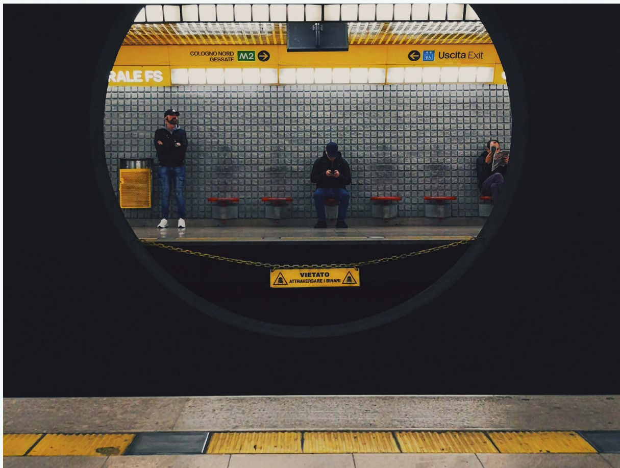
Stazione metro a Milano, Italia