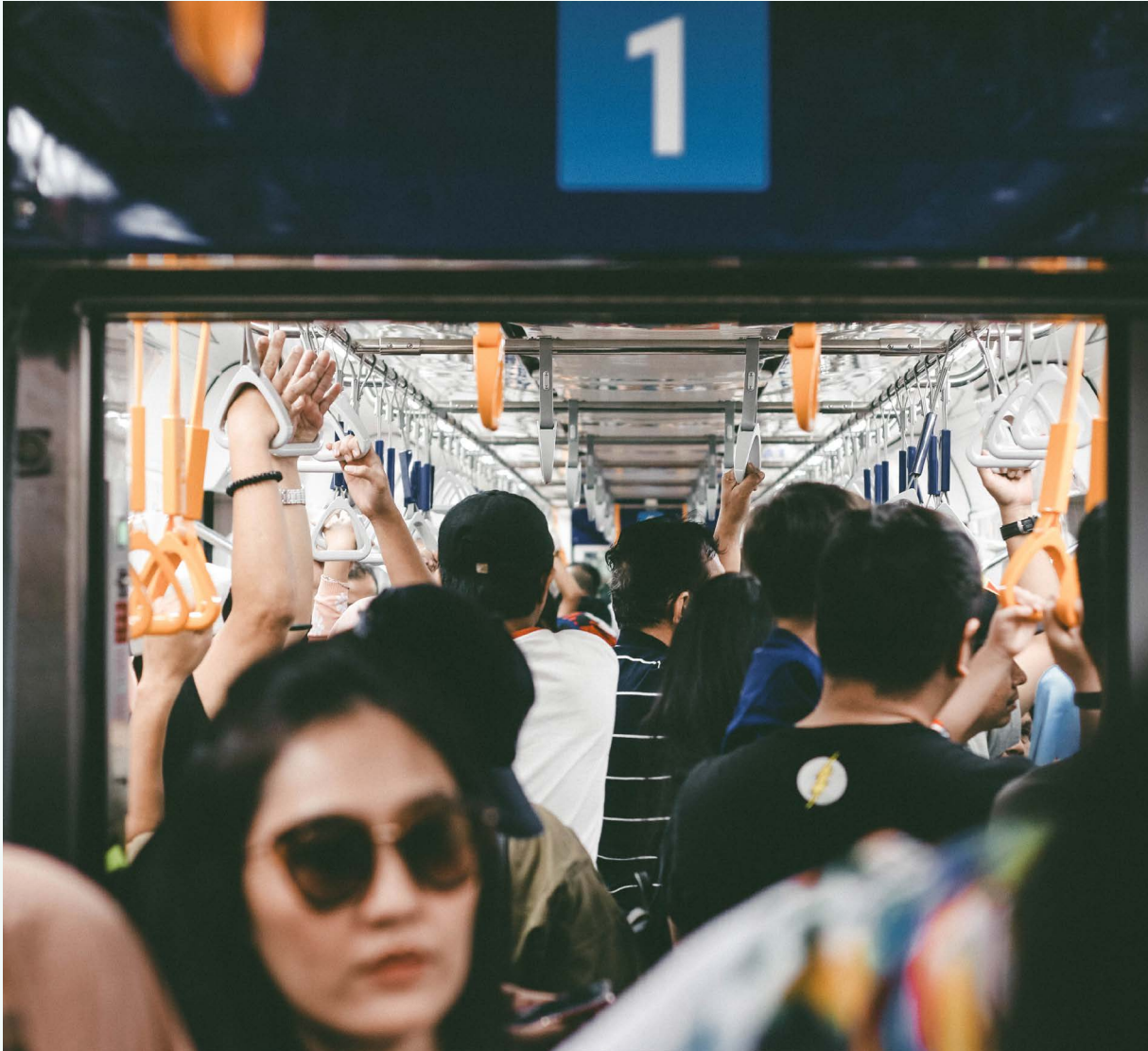
FOTO: Passegeri sull'MRT, Jakarta, Indonesia

“ Dobbiamo sviluppare l'infrastruttura come un insieme ... Abbiamo bisogno di veicoli adeguati e poi dobbiamo facilitare e rendere il cambio modale più attraente, in particolare per i pendolari. In questo modo, si avrà l'opportunità di passare dalla propria automobile privata al trasporto pubblico ... Abbiamo bisogno di un'accelerazione finanziaria per il trasporto pubblico locale e per le ferrovie ... dipende davvero dai finanziamenti”. Martin Burkert, Eisenbahn- und Verkehrsgewerkschaft (EVG), Berlino