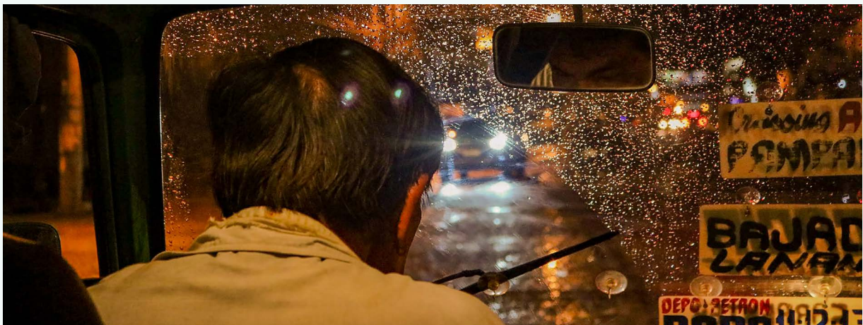
FOTO: All'interno di un jeepney a Davao, Filippine

“ [II] motore ... dei jeepney tradizionali ... ha [circa] 15-20 anni ... è caldo ai loro piedi. [E nel calore] il sudore gli si asciuga addosso. Quindi è molto pericoloso per loro. E non possono fermarsi perché ... devono continuare a pagare le bollette e la benzina e portare il salario a casa. ”