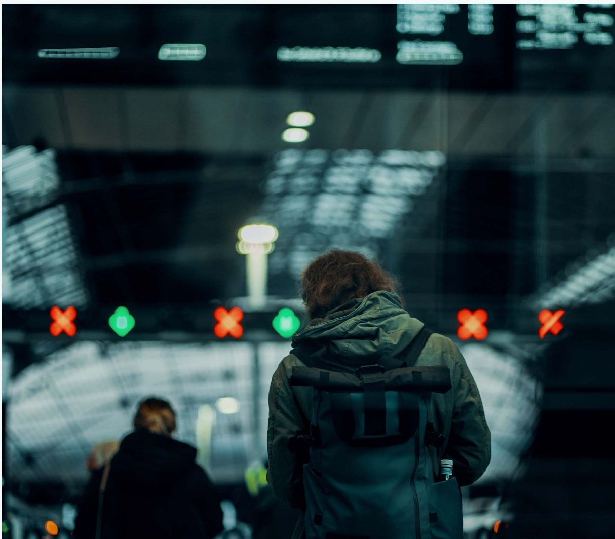
FOTO: Stazione di Queen Street, North Hanover Street, Glasgow, Regno Unito