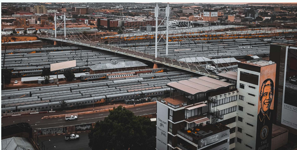
FOTO: Treni sotto il Mandela Bridge a Johannesburg, Sudafrica, di Tembinkosi Sikupela | FONTE: Unsplash

Gli intervistati descrivono un misto di problematiche di fondo: i finanziamenti a breve termine collegati ai cicli politici e a chi controlla le spese; pressione da parte di altri gruppi di interessi alle spese del trasporto pubblico; politiche di privatizzazione e informalizzazione , e in alcuni casi corruzione; e approcci restrittivi che mettono il trasporto in una bolla , non vedendo la connessione con le aree politiche quali l'ambiente, la salute e lo sviluppo.