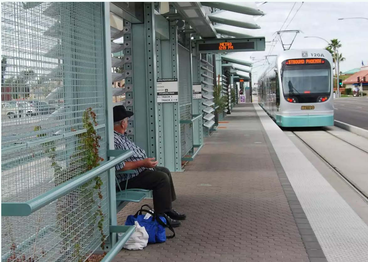
FOTO: Fermata del tram a Phoenix, USA

A Phoenix, una città che copre una grande area e dove la maggior parte dei viaggi sono fatti con veicoli privati, gli elettori hanno appoggiato maggiori investimenti nel trasporto pubblico nel 2015. I funzionari comunali hanno spiegato come, avendo già investito in una flotta di veicoli più pulita, hanno iniziato ad aggiungere rotte, integrando corse più presto e più tardi durante la giornata, aumentando la frequenza e coordinando gli orari degli autobus e dei tram. Hanno discusso gli approcci con la comunità locale e incluso la posizione delle comunità più fragili nell'organizzazione. Con le temperature che raggiungono nuove massime, hanno guardato come rendere il trasporto pubblico più attraente, con iniziative come le fermate all'ombra, in modo che le persone possano aspettare e prendere gli autobus in maniera più confortevole. Questa strategia ha visto l'aumento del numero dei passeggeri prima della pandemia e un riscontro positivo tra le persone che non avevano usato il trasporto pubblico in passato.