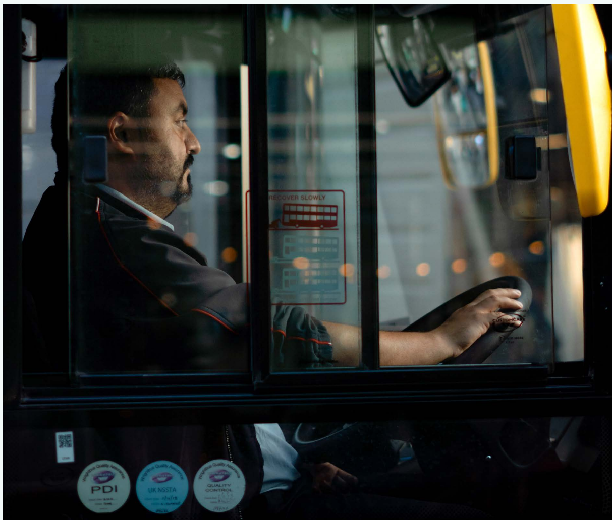
FOTO: Autista degli autobus a Londra, Regno Unito, di Just Jack | FONTE: Unsplash

Gli intervistati nelle città come Johannesburg hanno raccontato di operatori del trasporto pubblico, inclusi quelli di proprietà e gestione private, che hanno smesso di lavorare durante i lockdown, lasciando il trasporto informale quale unico mezzo per riempire i buchi. E i lavoratori informali specialmente sono stati troppo spesso lasciati senza un'entrata o assistenza sufficiente durante i lockdown , forzati a cercare altri mezzi per sopravvivere e, nei casi peggiori, si sono trovati criminalizzati per accattonaggio. Questo ribadisce il bisogno di un sistema con finanziamenti pubblici sostenibili e lavoro formalizzato con le adeguate protezioni per i lavoratori.