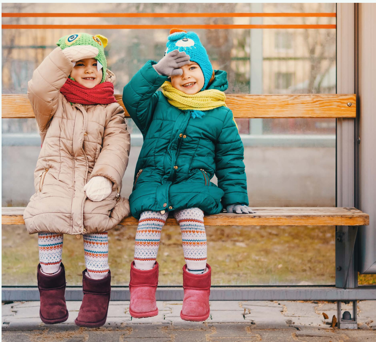
FOTO: Due bambine a una fermata dell'autobus a Varsavia, Polonia

Dobbiamo guidare e saldamente appoggiare la dedizione e il talento dei leader, dei funzionari e dei lavoratori dei trasporti delle città fornendo sostegno finanziario immediato, a lungo termine e stabile da parte del governo. Per raddoppiare la percentuale dei viaggi del trasporto pubblico nelle città e mantenerci nel percorso che permette l'aumento del riscaldamento globale massimo di 1,5°C, è necessario che i governi nel mondo si facciano avanti, agiscano e prendano decisioni finanziarie coraggiose. Il momento di agire è ora. Il futuro è il trasporto pubblico.