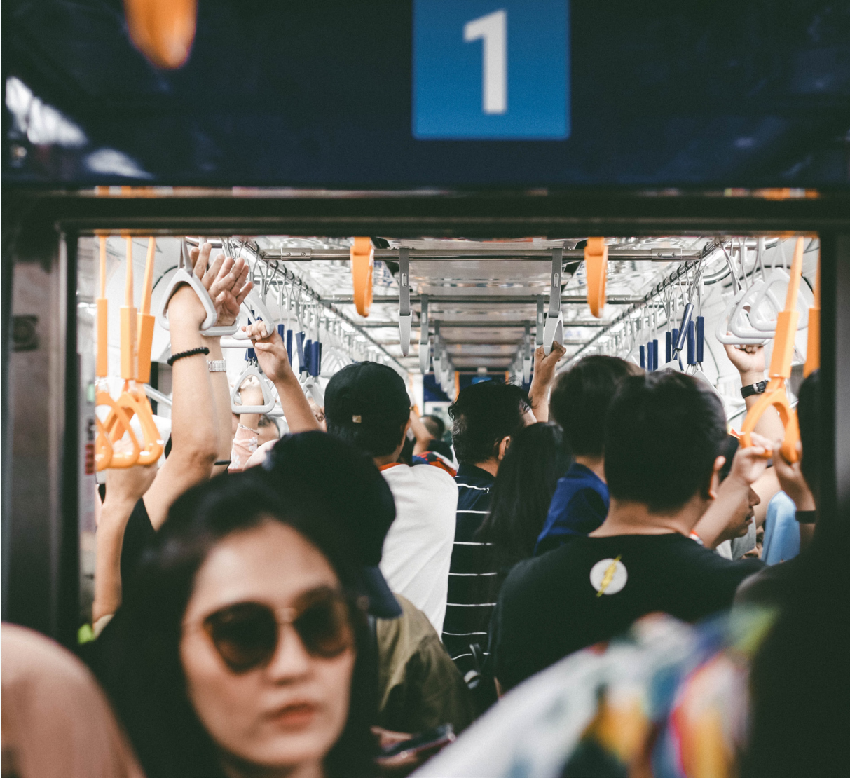
المسافرون على متن حافلات النقل الجماعي السريع MRT، جاكرتا، إندونيسيا،