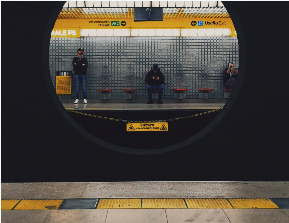
صورة: محطة مترو في ميلانو، إيطاليا

هناك الكثير من الوظائف التي تتطلب مهارات عالية... وسيتعين إعادة تدريب كل هؤلاء العمال... ولكن ماذا سيحدث لهم مع كهربية وسائل النقل؟ نحن نريد أن يبقى [هؤلاء العمال] موظفين، ولكنهم بنفس الوقت يحتاجون إلى التدريب حتى يتمكنوا من شغل وظائف مماثلة وبنفس المستوى. فأنت لا تستطيع أن تطلب اليوم من الميكانيكيين الذين يقومون بوظائف عالية المهارة أن يقوموا بأعمال منخفضة المهارة في المستقبل." أنجيلو بيشيريلو، الفيدرالية الإيطالية لعمال النقل (FILT CGIL)، ميلانو