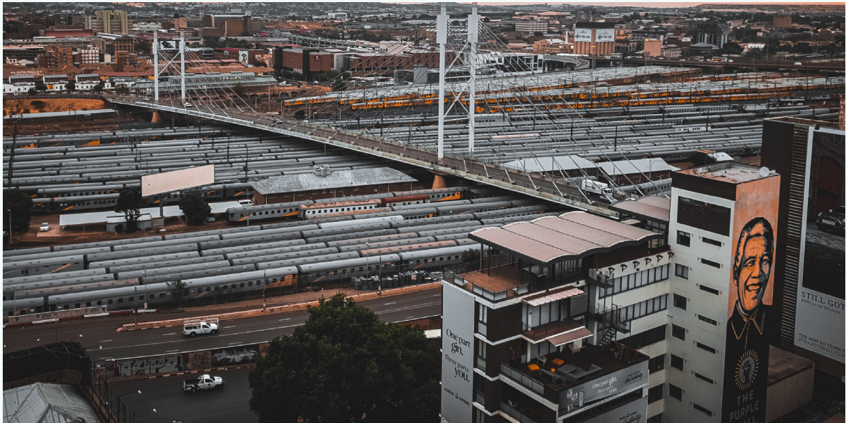
صورة: القطارات تحت جسر ماندبلا في جوهانسبرغ، جنوب أفريقيا

كما وصف الأشخاص الذين أجريت معهم المقابلات مجموعة من القضايا الأساسية مثل: التمويل القصير الأجل المرتبط بالدورات السياسية والجهات التي تتحكم في الإنفاق؛ والضغط من قبل جماعات المصالح الأخرى على حساب النقل العام؛ و سياسات الخصخصة والتحول إلى القطاع غير الرسمي ، وحتى الفساد في بعض الحالات؛ و المفاهيم الضيقة التي تضع النقل في موقف صعب ، وتفترق إلى كيفية ارتباطه بمجالات السياسة العامة مثل البيئة والصحة والتنمية.