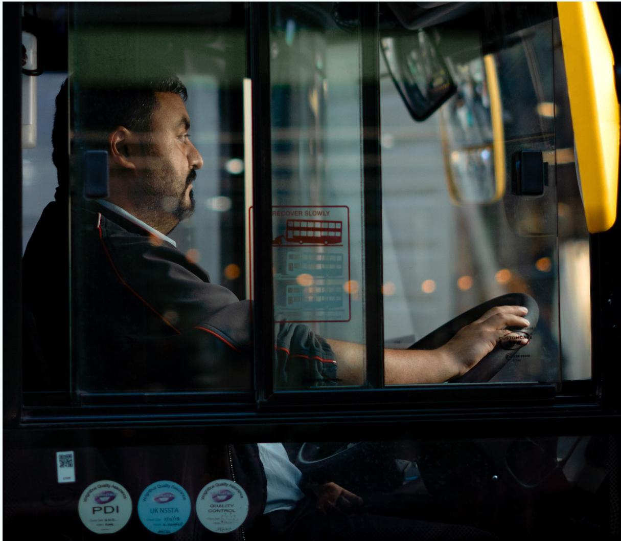
صورة: سائق حافلة في لندن، المملكة المتحدة

وقد وصف الأشخاص الذين أجريت معهم المقابلات في مدن مثل جوهانسبرغ بعض مشغلي النقل العام - بمن فيهم أولئك الذين يمتلكون ويديرون قطاع النقل الخاص - بأنهم تخلوا عن واجبهم خلال عمليات الإغلاق، تاركين ورائهم قطاع النقل غير الرسمي لسد هذه الثغرة. وغالباً ما يُترك العمال غير الرسميين على وجه الخصوص دون دخل أو مساعدة كافية خلال عمليات الإغلاق، ويجبرون على إيجاد وسائل أخرى للبقاء على قيد الحياة، وفي أسوأ الحالات، يحدون أنفسهم مجرمين بتهمة التسول. وهذا يعزز من الحاجة إلى نظام يتسم بتمويل عام مستدام، وعمل رسمي يتمتع بالحماية الكافية للعمال.