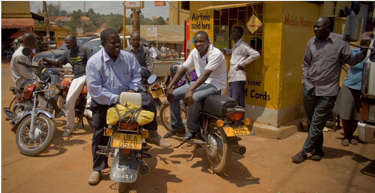
صورة: سائقو مركبات بودا بودا في كمبالا، أوغندا | المصدر: ITF

وتوفر هذه النتائج رؤى هامة تبرز الإجراءات التي يجب على صانعي القرار اتخاذها في مؤتمر COP26 والمؤتمرات اللاحقة.