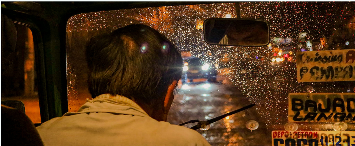
صورة: داخل مركبة جيبني في دافاو، الفلبين

فإن محركات مركبات الجيبني التقليدية... تبلغ [نحو] 15 إلى 20 سنة من العمر... وهي حارة جداً على أقدامهم. [وبسبب الحرارة] يحف العرق على ظهورهم. وهذا يشكل خطراً عليهم. وهم لا يستطيعون التوقف لأن... عليهم أن يواصلوا الدفع من أجل أقساط مركباتهم، والوقود، و[المبلغ] الذي يعودون به إلى منازلهم."